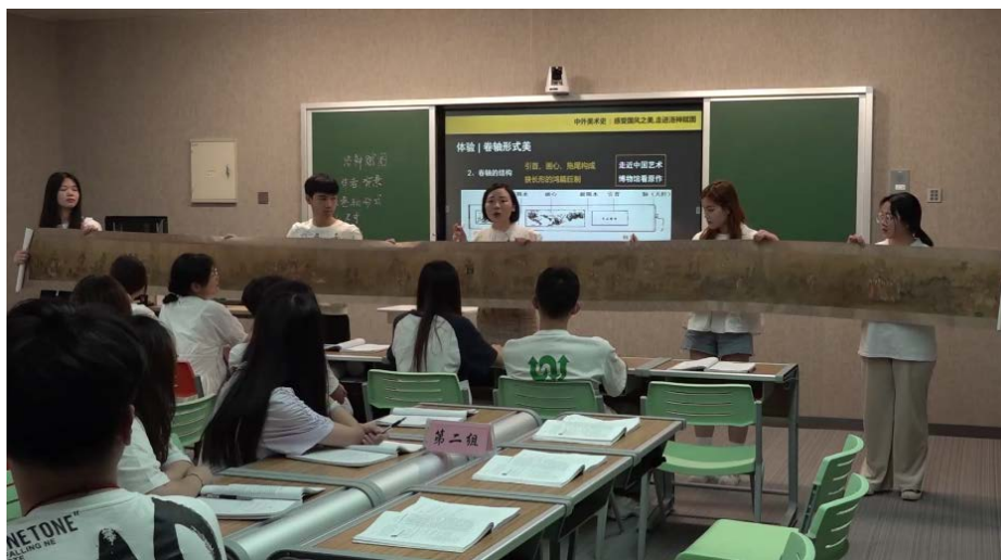
图一 师生一起分析“洛神赋图”形式与结构