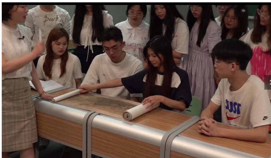
图二 师生一起观看“洛神赋图”