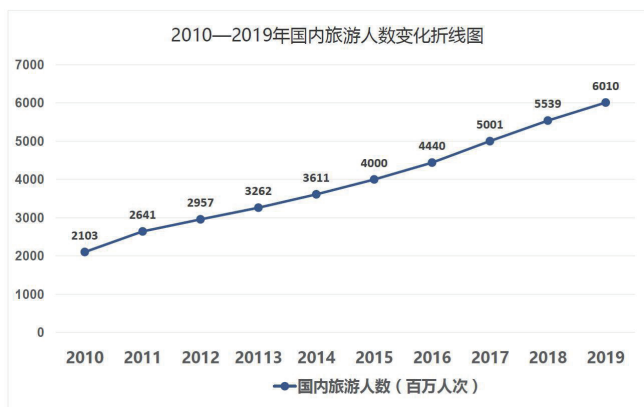
图1 2010—2019年国内旅游人数变化折线图 (根据国家数据库数据得出)