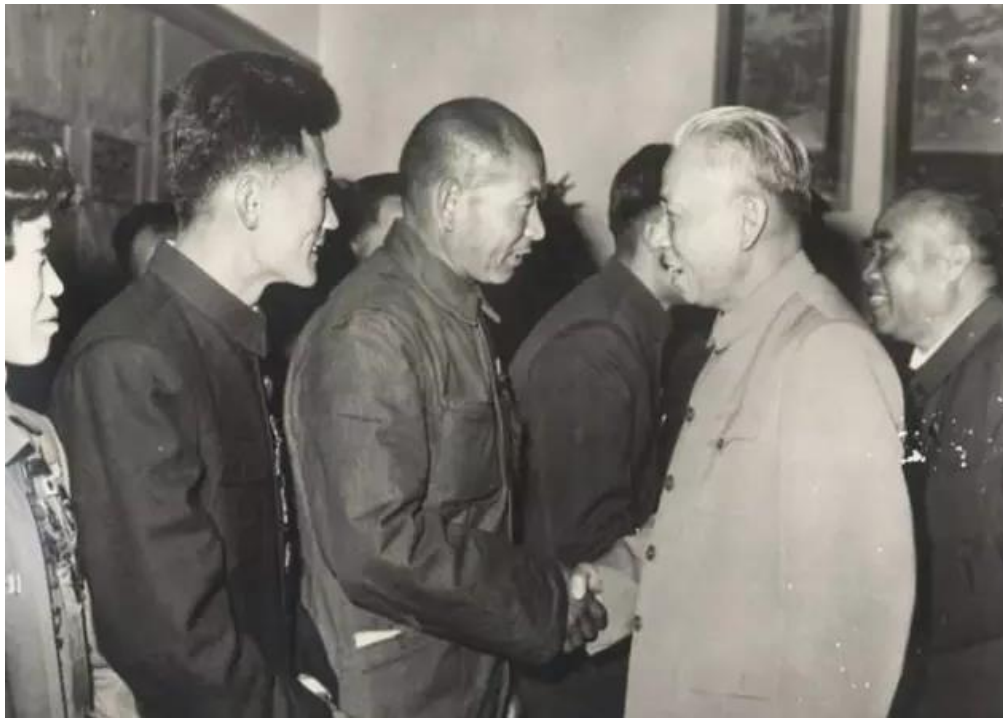
△刘少奇接见时传祥

价值观引领： 融入社会主义劳动价值观，“劳动最美”是我们对劳动者的尊重，社会主义核心价值观的内涵是以人为本，尊重劳动、尊重知识、尊重人才、尊重创造是我国发展建设的基本纲领，以人为本就是尊重人民群众的首创精神。在我国大步迈向小康社会的过程中，工人阶级和劳动群众发挥了主力军的作用，他们的辛勤劳动和艰辛付出才换来我们今天的幸福生活。