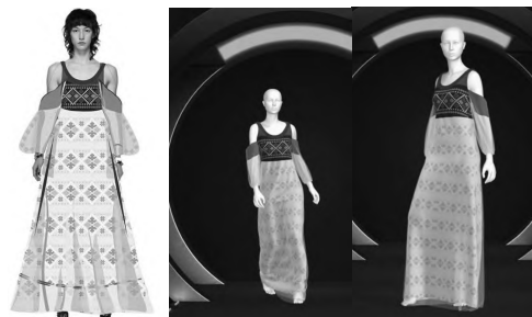
图3 《款式设计》PS、CLO3D 课程教学软件及工具融入(学生课程作业)