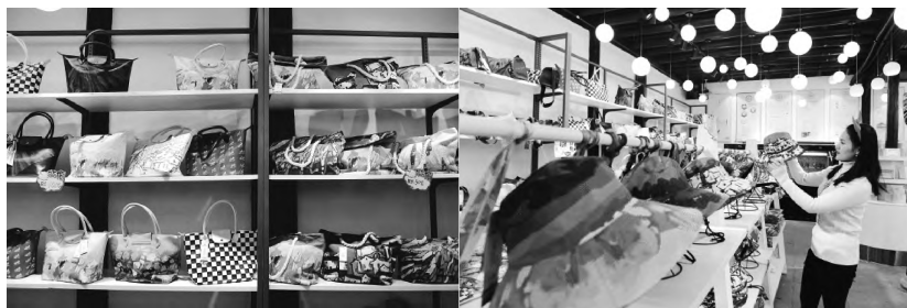
图1 “珍珠生活·鲁迅故里”——珍珠生活科创艺术馆商品区(学生主要参与设计)