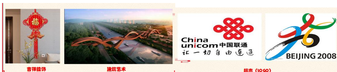
图 4 知识点的实际运用案例展示

思政元素融入专业课程： 现在有非常多的物品上都用到盘长结。（展示图片进行讲解）如新年里长辈悬挂在家中喜气洋洋的盘长结摆件，代表着家庭中每个成员新年平平安安、和和美美的美好愿望，梅溪湖中国结大桥，这个被称为“世界最性感建筑”之一，相互交织而又蜿蜒盘旋的盘长结将梅溪湖周边地区紧紧的相连，中国电信的标志，信达畅通的的通讯事业将中国领土上家家户户紧紧相连。