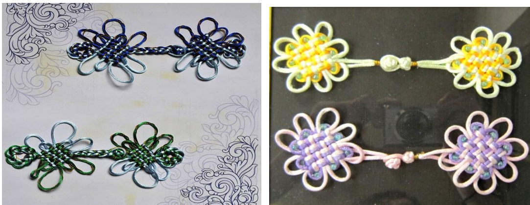
图10 学生盘长结综合设计作品案例

课后创作：爱国教育——在国庆节到来之际，请同学们结合课堂上前期所学习的编结技法进行小组创作，为祖国献上一份贺礼，表达对祖国的热爱。培养学生的团队协作能力和创新精神。