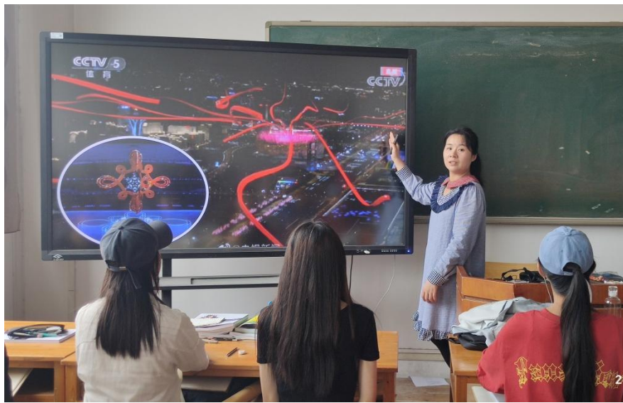
图 2 教师通过时政热点视频导入知识点