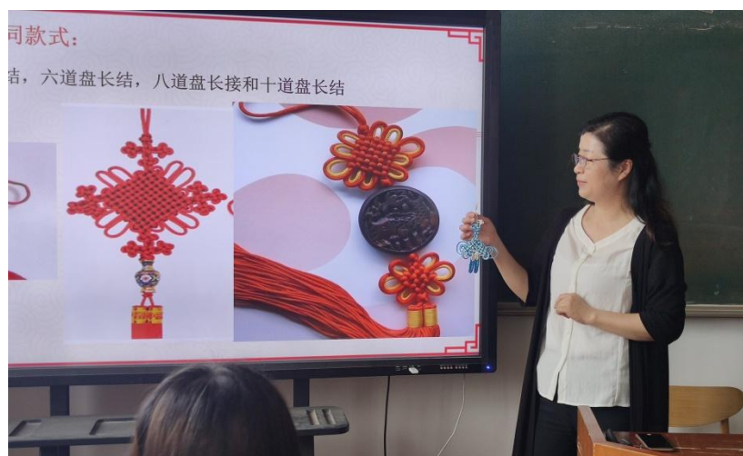
图 3 联系古今讲解盘长结知识点

知识点 2（文化内涵）讲解： 盘长结，纹理分明、造型明显，是中国结艺中最有代表性的“结”之一。也叫同心结，盘长结缘起于中国传统婚礼上结发而成的“同心结”，自汉开始，天朝男女就设坛祭祀天地祖宗，大宴亲朋，在天地亲朋“注视”下绾编青丝为结，喻意“阴阳相合，同心不负，生生不息”！实际效果上亦确实因天地祖宗之神威天恩，一众参宴观礼亲朋之视威爱抚，夫妻亲蜜不负。千万传承至今，婚礼即是结发礼，非结发礼不为真正婚礼和盟誓已成规识。凡结发必为永誓同心亦成共知。