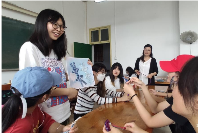
图8 学生讲解盘长结作品设计过程