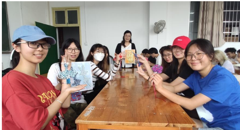
图9 学生展示盘长结设计作品