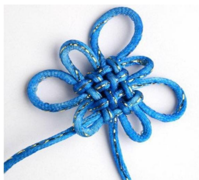
图 6 盘长结成品实物图