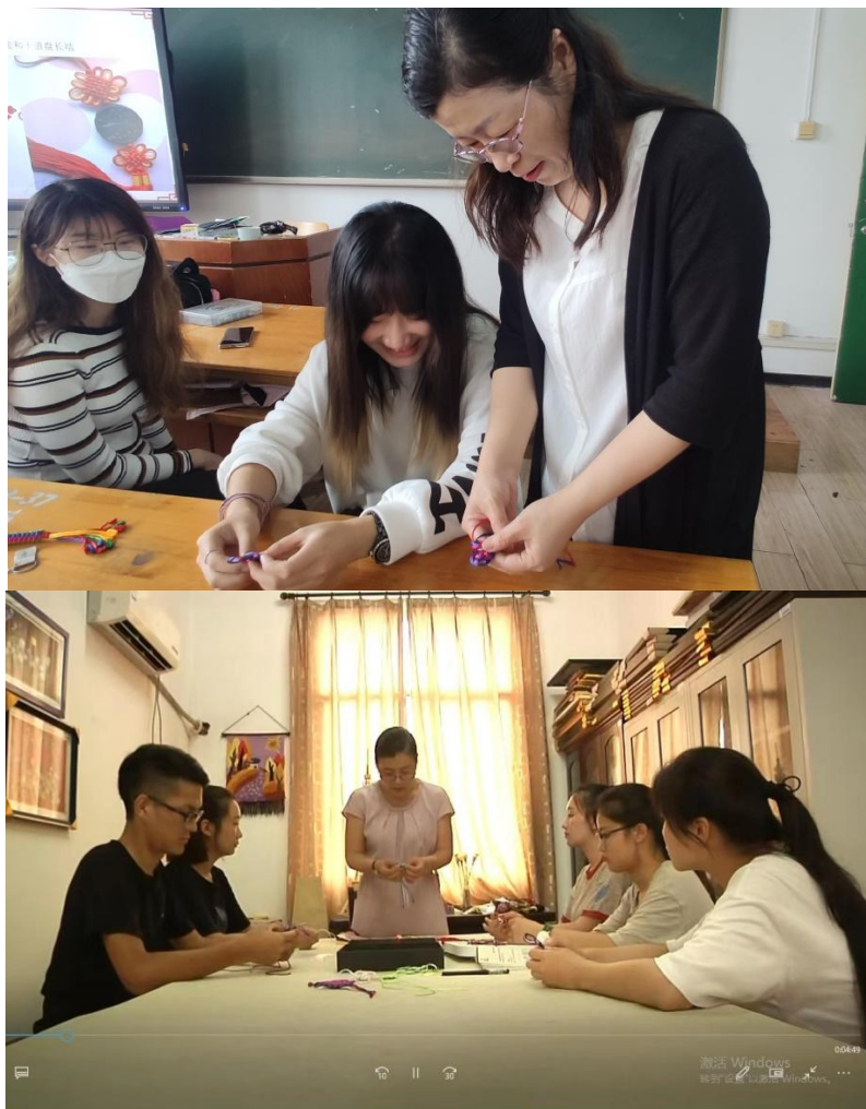
图 7 盘长结教授过程

在学生沉浸在民族的自豪感中教授盘长结的编织技法。在制作过程中感悟“课程思政”与“工匠精神”及中国传统艺术精神。